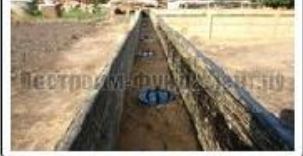
Ряд свай ТИСЭ в опалубке