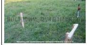
Разметка фундамента, вынос осей