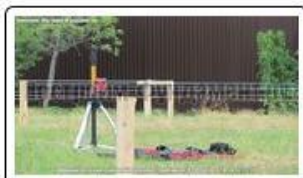
Разметка с применением лазерного нивелира