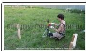
Вынос осей фундамента