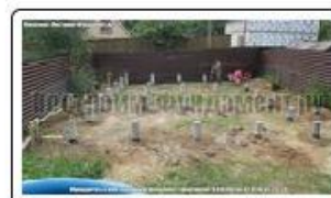
Сваи ТИСЭ с применением съемной опалубки