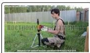
Разметка фундамента с применением лазерного нивелира