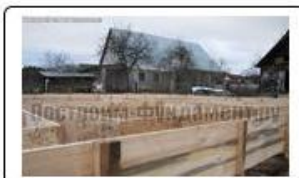
Опалубка для фундамента по технологии ТИСЭ