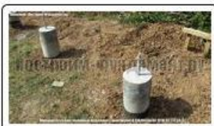
Сваи ТИСЭ с анкером под ростверк из бруса