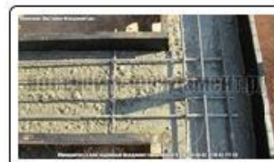
Бетонирование ТИСЭ фундамента