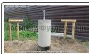
Сваи ТИСЭ, вывод из земли на 60-100 см